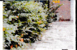
De rand van de verharding of het gras is redelijk zichtbaar. B