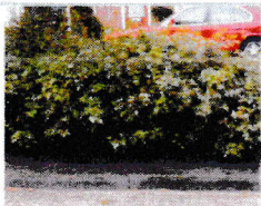
Er is geen onkruid. A+