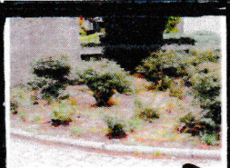
Er is in beperkte mate onkruid. B