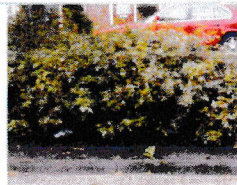
Er is weinig onkruid. A