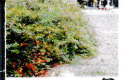
De rand van de verharding of het gras is niet zichtbaar. D