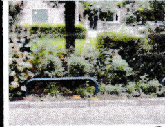
Er is redelijk veel onkruid. C