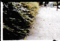
De rand van de verharding of het gras is nauwelijks zichtbaar. C