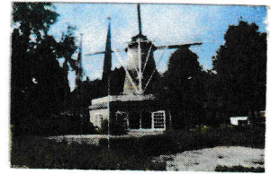
BPT Oude Omdraaier www.oudeomdraaier.nl

Op maandag 12 juni loopt het BPT door de buurt "Oude Omdraaier" samen met medewerkers van wijkteam Kaatsheuvel Oost Samenwerkendewijk (oa. gemeente, politie, contourdetwern -zorg-) voor een kritische opname van hoe het erbij staat in de Oude Omdraaier (kaart aan ommezijde).