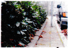
De rand van de verharding of het gras is volledig zichtbaar. A+