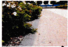
De rand van de verharding of het gras is goed zichtbaar. A