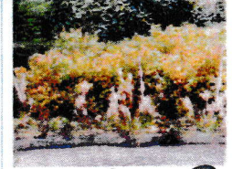
Er is veel onkruid. D